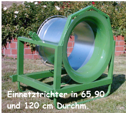
Einnetztrichter in 65,90 und 120 cm Durchm.